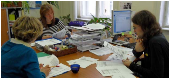
Přehraniční spolupráce na JTS

Od 1. května 2011 mohou na rakouský trh z výše uvedených zemí vstoupit také zahraniční firmy i se svými zaměstnanci. Skeptici proto poukazují na to, že by v důsledku nižších mezd mohlo docházet k nerovné soutěži mezi stávajícími a nově příchozími firmami.