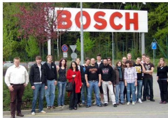
Exkurze studentů z FH Technikum Wien u firmy Bosch v Jihlavě

Společné vědomostní platformy a sítě tvoří základ pro fundovanou IT-Knowledge-Community. Vysoká škola polytechnická Jihlava (VŠPJ) jako vedoucí partner a Fachhochschule Technikum Wien si proto daly za cíl rozšíření vědomostí v oblasti nejrůznějších technologií budoucnosti formou výměny studentů a odborných praxí v sousední zemi. Tyto zahraniční praxe u renomovaných národních a mezinárodních podniků v Rakousku i v Česku by měly studentům v oborech Elektrotechnika a Informatika přinést nové zkušenosti a optimálně je připravit na jejich vstup do pracovního života. Další součástí projektu jsou prezentace získaných vědomostí a dovedností v rámci workshopů.