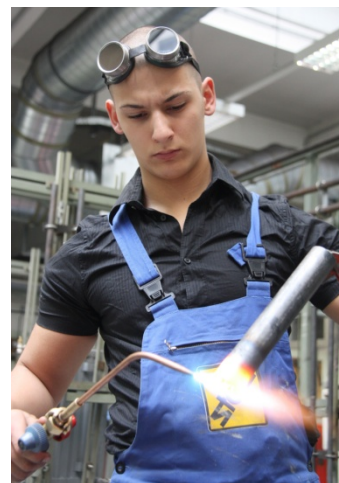
ZUWINS, česko-rakouská soutěž učňů 2010

cujících žen a učňů, resp. na mládež v pracovním procesu.